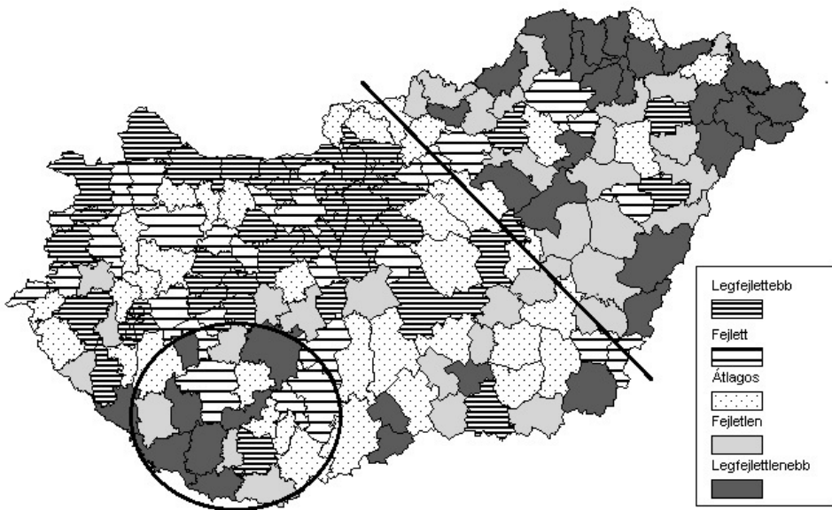
2. ábra: Kistérségek fejlettsége a 67/2007. (VI.28.) OGY. határozat alapján